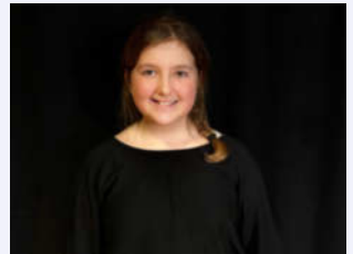
- Professorin Einlauf -