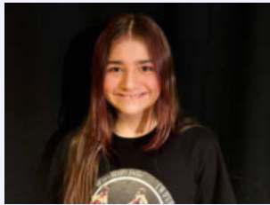
- Hermine -