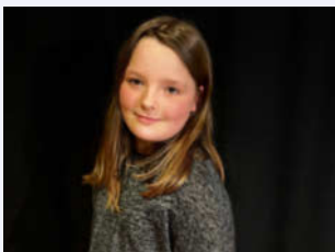
- Bim -