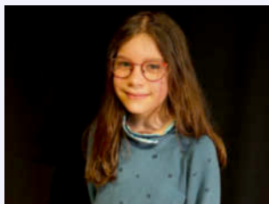
- Bam -